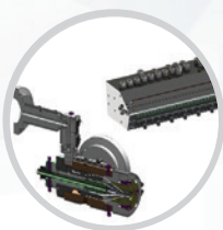
Design a výroba nástrojů pro vytlačování plastů (hlavy, trysky atd.)