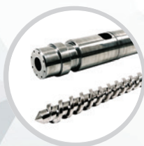
Šneky a komory