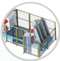
Hydraulický otvírač forem