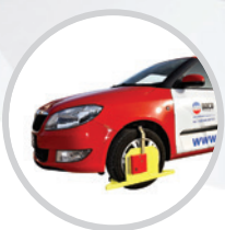
Zabezpečovací botičky na automobily